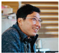
이 래 각 속초시민약국 대표약사